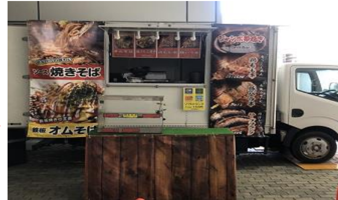
営業風景 (前出しあり)