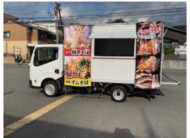
営業風景 (前出しなし)