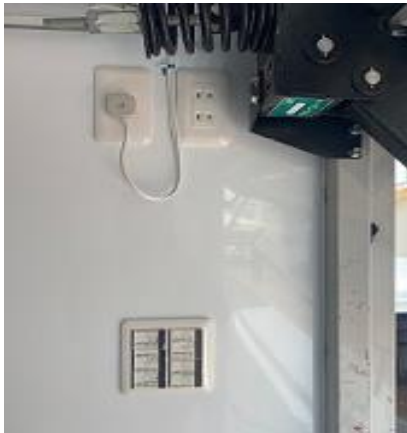
照明スイッチ (運転席側後方)