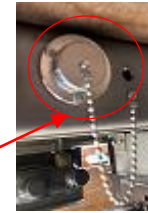
外部電源差し込み口