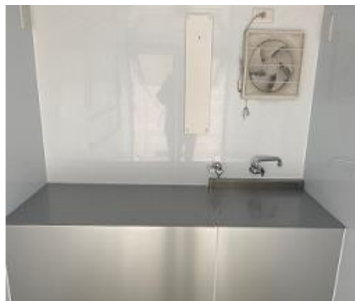
作業台 (2槽シンク蓋つき)