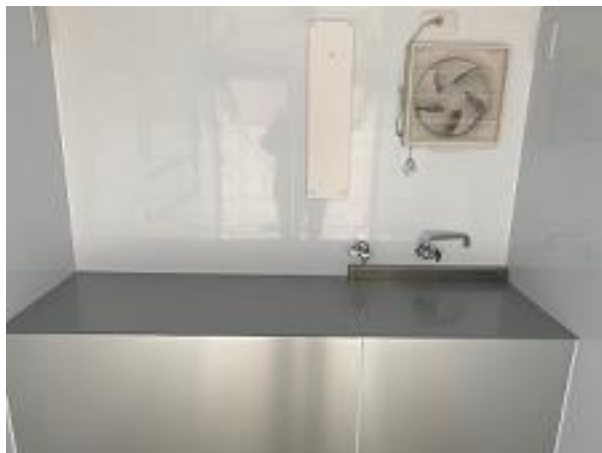
作業台、2槽シンク (蓋つき) (200Lタンク)