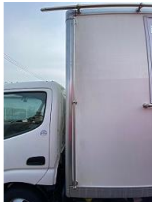
看板取り付け可能 フレーム