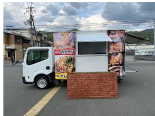
営業風景 (前出しあり)