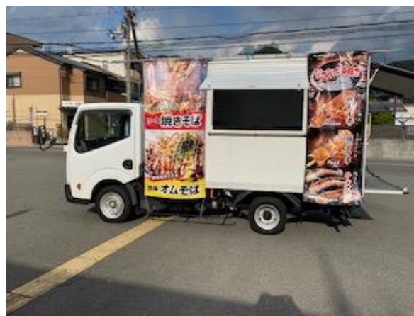
営業風景 (前出しなし)