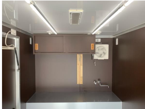
作業台 (2槽シンク蓋つき)