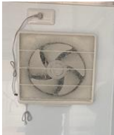
換気扇 (運転席後方)