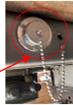
外部電源差し込み口