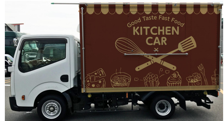
販売面 (販売口間口)