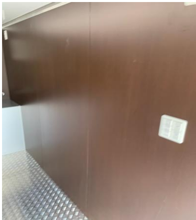
照明スイッチ (運転席側後方)