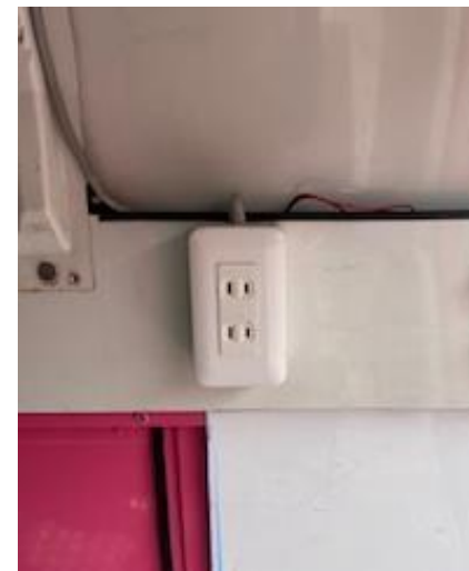
電源 (運転席側後方)