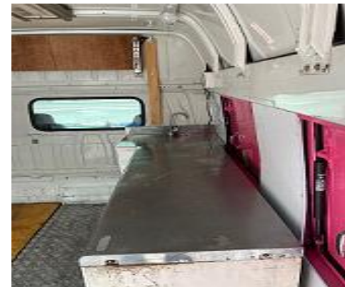
作業台、冷蔵庫(オプション)