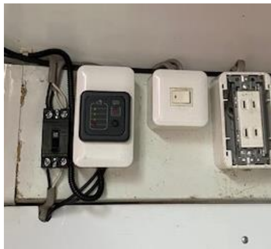
電源スイッチ (助手席側後方)