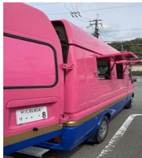
販売口開口 (右後方から)