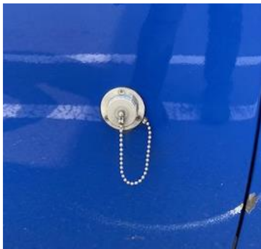
外部電源 (助手席側後方)