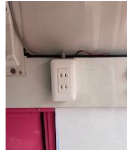
電源 (運転席側後方)