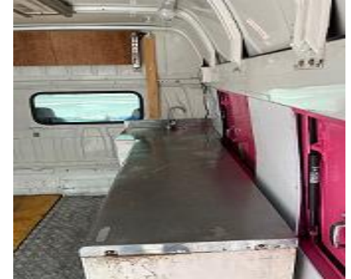
作業台、冷蔵庫(オプション)