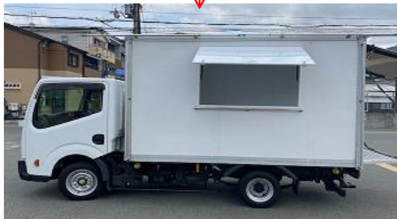
販売面 (販売口間口)