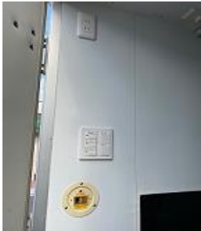
照明スイッチ (助手席側後方)