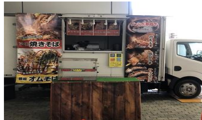
営業風景 (前出しあり)