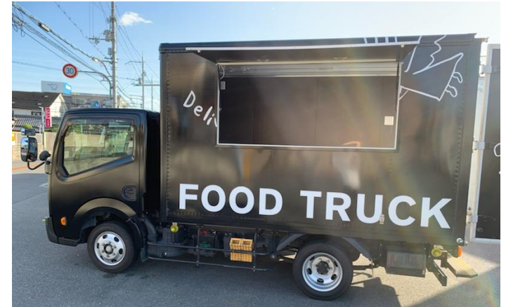
販売面 (販売口間口)