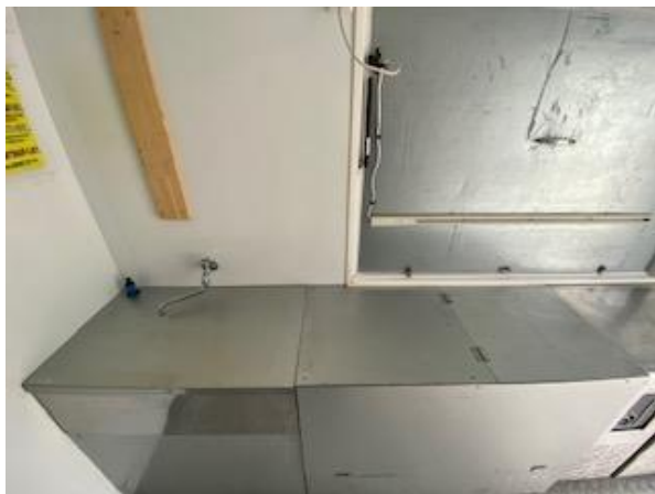
作業台、2槽シンク (蓋つき) (200Lタンク)