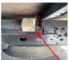
外部電源差し込み口