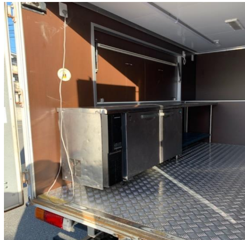
作業台、冷蔵庫 (冷蔵庫オプション)