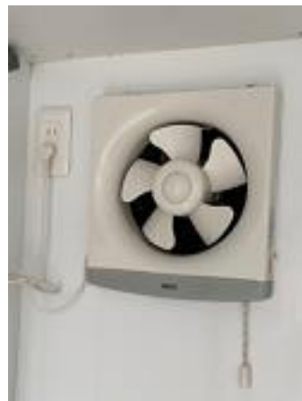
換気扇 (助手席後方)