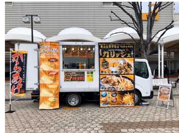
営業風景 (前出しなし)