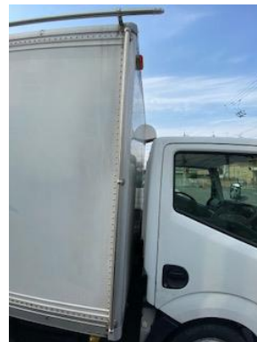
看板取り付け可能 フレーム